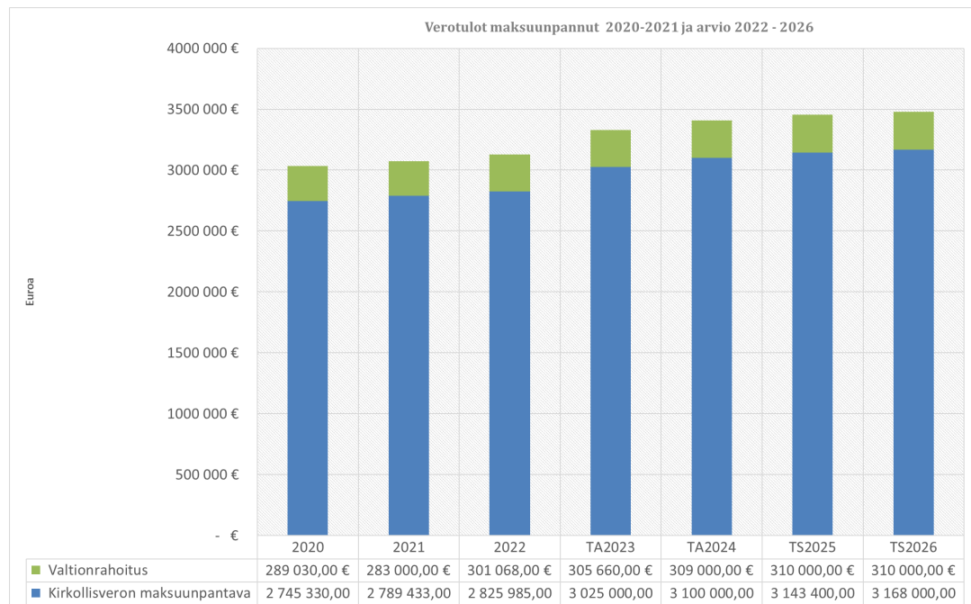
Kuva 3 Verotulojen ja valtionrahoituksen kehitys 2020-2026.

Vuodelle 2024 kirkolle suunnattu valtionrahoitus on yhteensä 124 133 000 euroa . Rahoituksesta 7 881 100 euroa on tarkoitus käyttää seurakuntien kulttuurihistoriallisesti arvokaiden rakennusten ylläpitoon ja 2 445 100 euroa Kirjuri-jäsentietojärjestelmän ylläpito- ja Basis-kiinteistörekisteriin 260 000 euroa . Seurakunnille summasta jaetaan 113.806.000 euroa . Kuusamon seurakunnan osuus valtionrahoituksesta on arviolta 309.000 euroa .