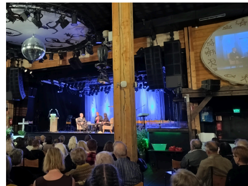
kuvia Kittilän lähetysjuhlilta 2025